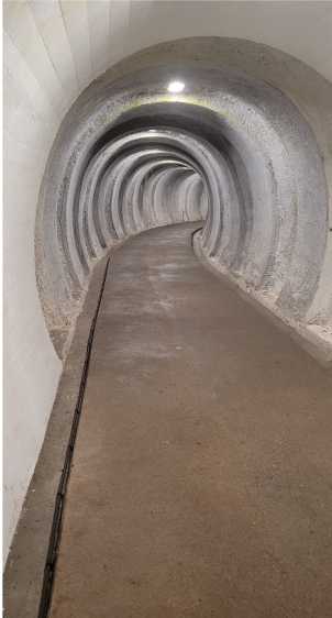
Indgangstunnelen til REGAN VEST, ca. 300 m lang.

Erik viste billeder fra de forskellige steder og fortalte om de forskellige funktioner, meget fint suppleret af Hans Fink, som havde været "ansat" der, dvs. han var bl.a. blevet bedt om at observere, hvilke biler, der holdt ved vores militær anlæg og flyvepladser, når han kørte rundt i landet via sit arbejde, altså skrive nummerpladerne ned, det skulle være meget hemmeligt, han måtte ikke en gang fortælle det til sin kone.