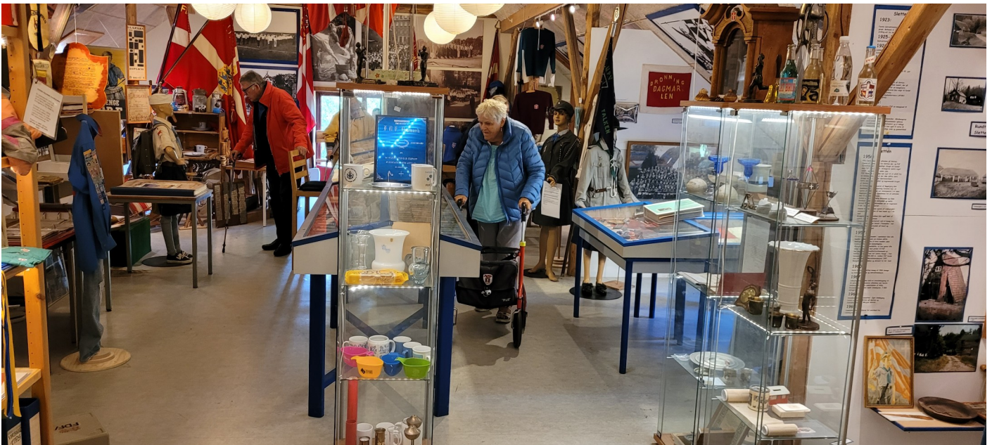
2 billeder fra FDF's historiske Samling på Sletten.